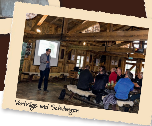
Vorträge und Schulungen